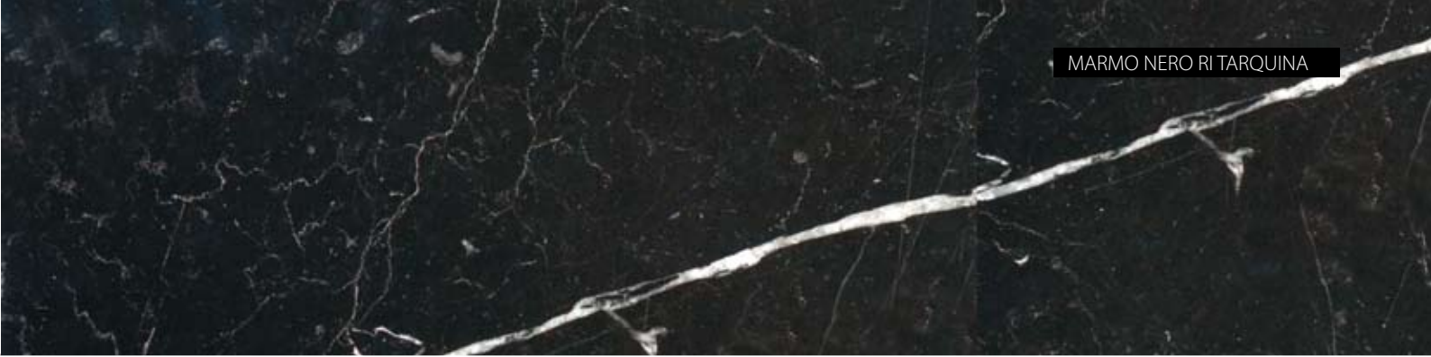
MARMO NERO RI TARQUINA