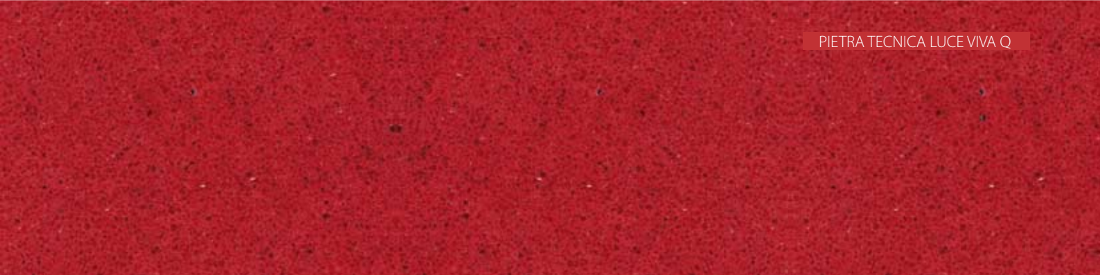
PIETRA TECNICA LUCE VIVA Q