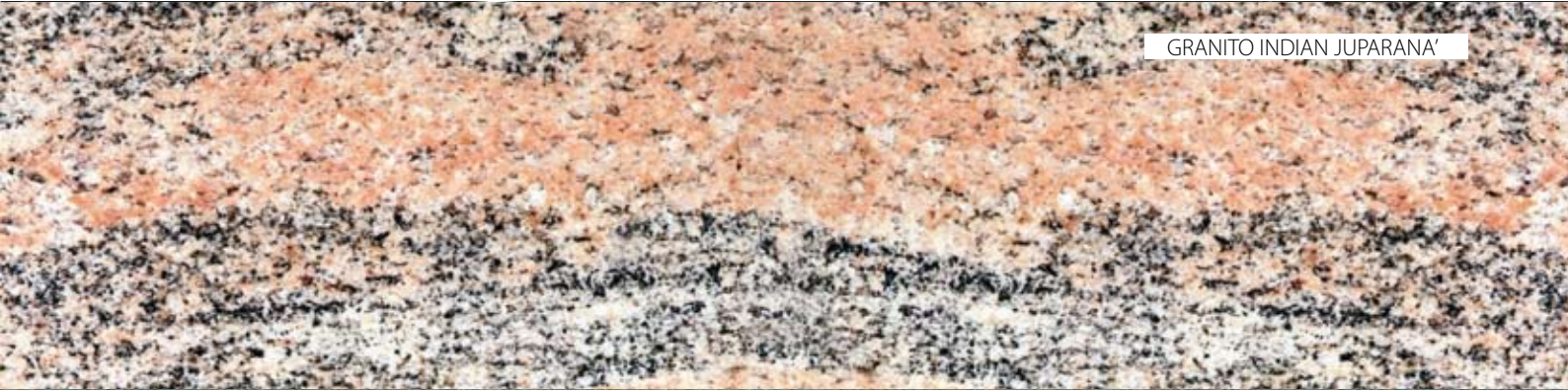
GRANITO INDIAN JUPARANA'